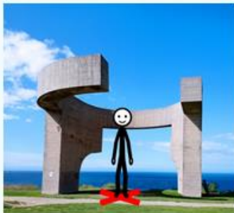
SI ME COLOCO AQUÍ