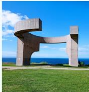
DEL ELOGIO DEL HORIZONTE