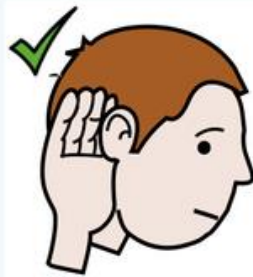
ESCUCHO MUY BIEN