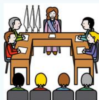
ALCALDESA Y CONCEJALES.