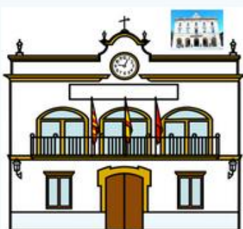
EN EL AYUNTAMIENTO