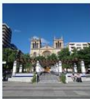
EN EL PARQUE DE LOS PATOS